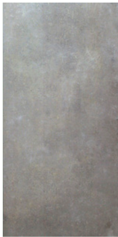
GRAFITE (Gris foncé)

30x60.4 cm (11.81"x23.78") Fini mat OL.AI.GFT.1224