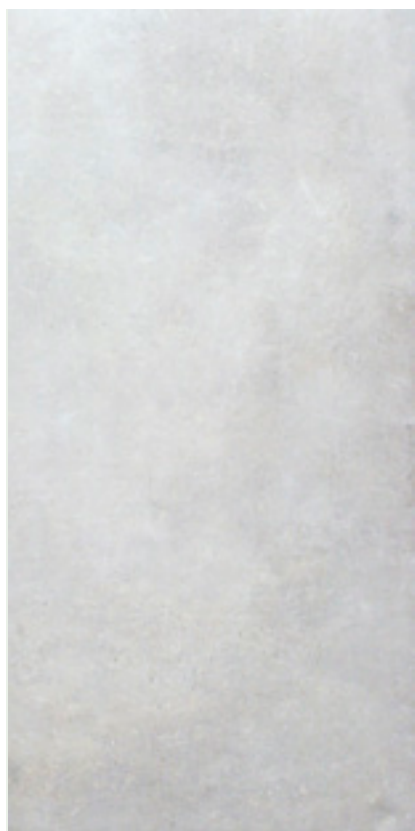
FUMO (Gris Pâle)

30x60.4 cm (11.81"x23.78") Fini mat OL.AI.FUM.1224