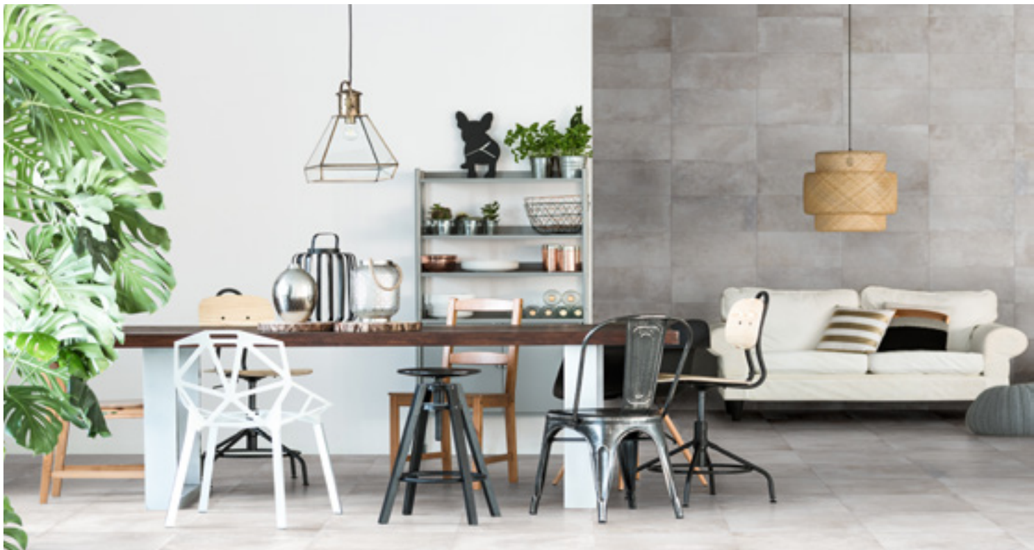
FUMO (Gris Pâle)